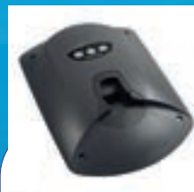
DÉTACHEUR ENCASTRÉ ACOUSTO-MAGNÉTIQUE (AM) IDENTIFICATION PAR RADIOFRÉQUENCE (RFID)

Le détacheur AM/RFID SuperTag Sensormatic allie performances et visibilité en temps réel sur les stocks et les ressources afin d'améliorer les opérations et d'optimiser la rentabilité, tout en créant une expérience inoubliable pour les clients.