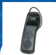
ANTIVOL SUPERTAG AVEC ALARME À 2 TONALITÉS ET ÉLINGUE ACOUSTO-MAGNÉTIQUE (AM)