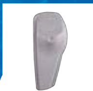
ANTIVOL SUPERTAG III ACOUSTO-MAGNÉTIQUE (AM)