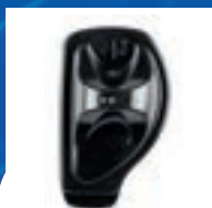
ANTIVOL SUPERTAG VST-R DÉSACTIVABLE ACOUSTO-MAGNÉTIQUE (AM)