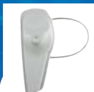
ANTIVOL SUPERTAG III À ÉLINGUE ACOUSTO-MAGNÉTIQUE (AM)