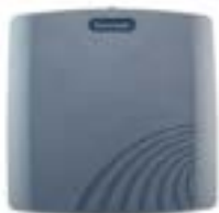
IDENTIFICATION PAR RADIOFRÉQUANCE (RFID)