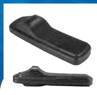
ANTIVOL SUPERTAG AVEC ALARME À 2 TONALITÉS ACOUSTO-MAGNÉTIQUE (AM)