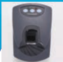
DÉTACHEUR MONTÉ SUR LE COMPTOIR ACOUSTO-MAGNÉTIQUE (AM) IDENTIFICATION PAR RADIOFRÉQUENCE (RFID)