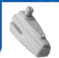
ANTIVOL MAGNÉTIQUE INFUZION ACOUSTO-MAGNÉTIQUE (AM) RADIOFRÉQUENCE (RF)